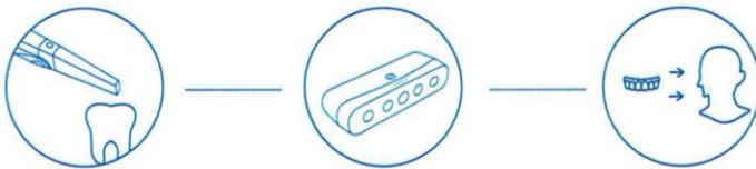
Alineación automática intraoral-facial

El software incluye varias herramientas para la simulación de ortodoncias, como la extracción y detección automática del labio o la segmentación de las piezas en 1 clic.